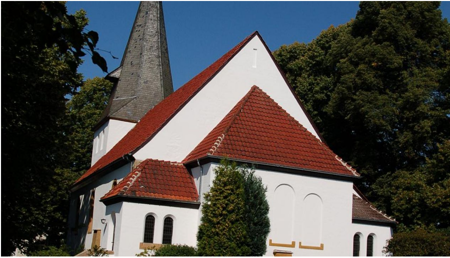
St. Gangolf-Pfarrkirche