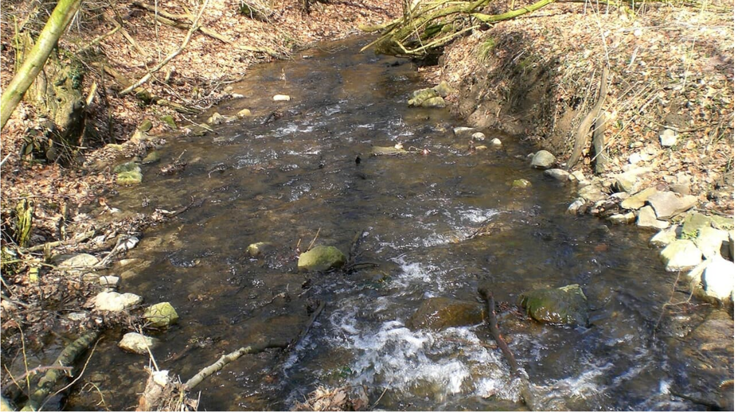
Gohfelder Schweiz - © Biologische Station Ravensberg im Kreis Herford e.V.