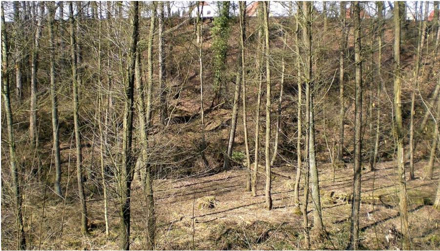
Gohfelder Schweiz