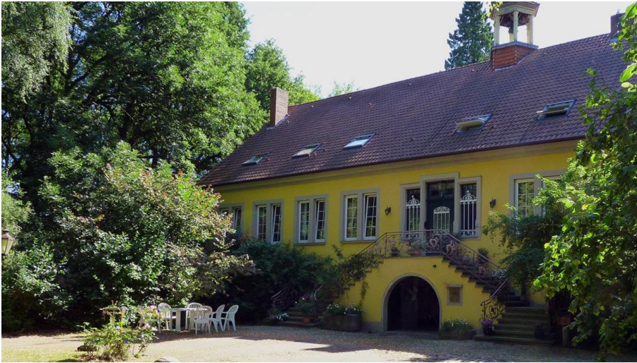
Haus Beck