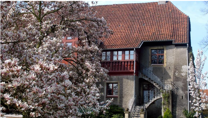
Haus Kilver