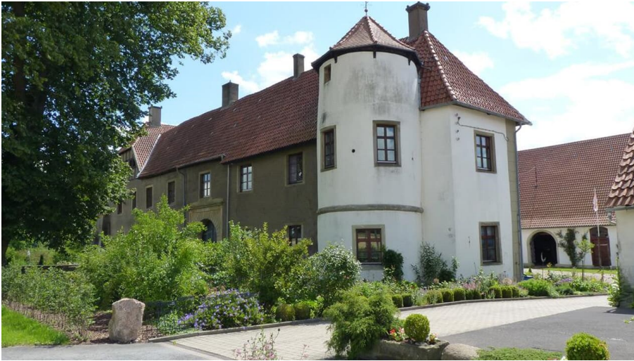
Haus Kilver - Turm