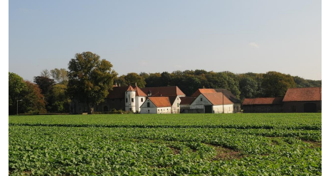
Haus Kilver - © Biologische Station Ravensberg im Kreis Herford e.V.