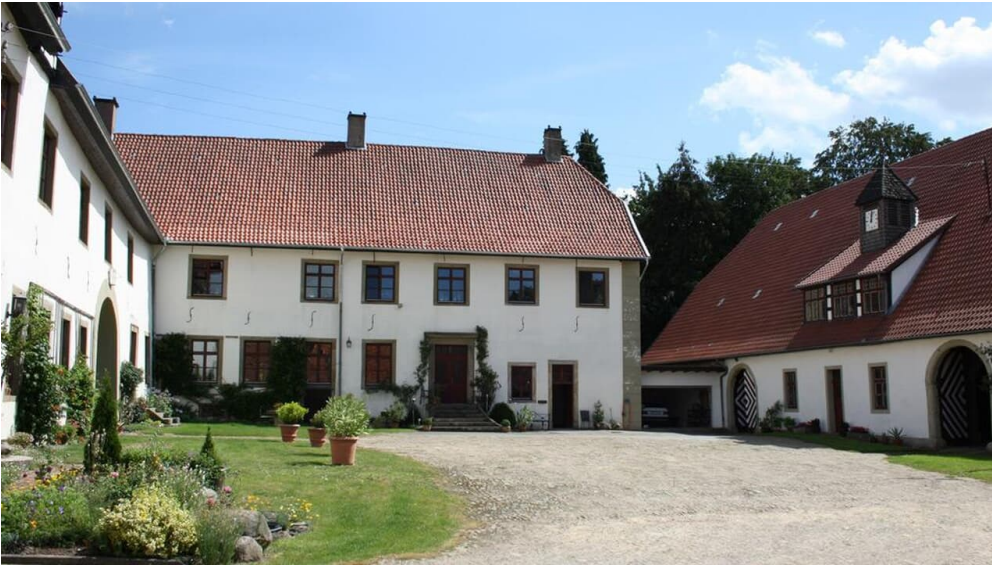
Haus Kilver - Innenhof