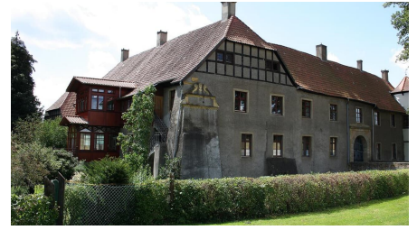
Haus Kilver - © Biologische Station Ravensberg im Kreis Herford e.V., Unbekannt, Biologische Station Ravensberg im Kreis Herford e.V. & nbsp;