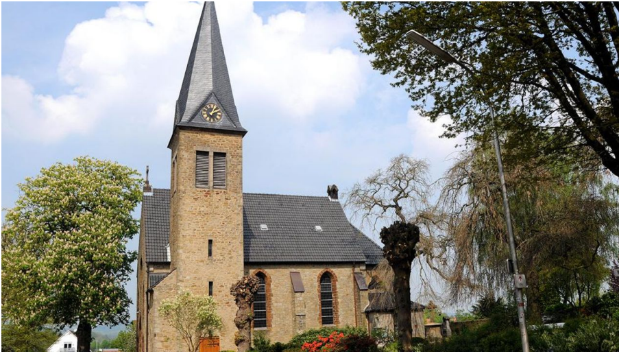
Michaelkirche - © Biologische Station Ravensberg im Kreis Herford e.V.