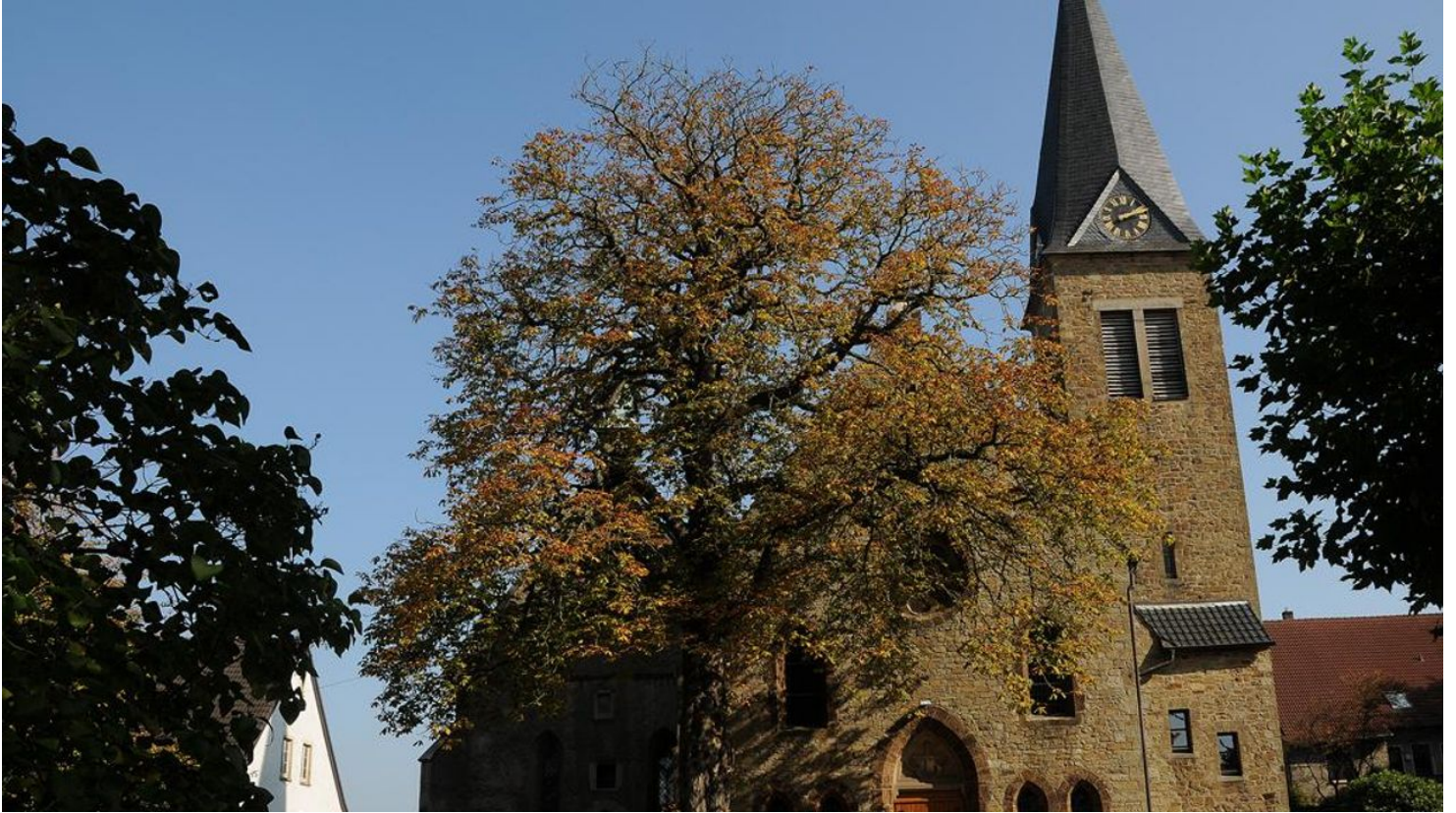
Michaeliskirche - © Biologische Station Ravensberg im Kreis Herford e.V.

Immer wissen, was fährt - eine kostenlose Nummer für alle Fälle: Unter 08006 50 40 30 erhalten Bus- und Bahnkund*innen in NRW rund um die Uhr Tarifinformationen, Fahrplanauskünfte und mehr.