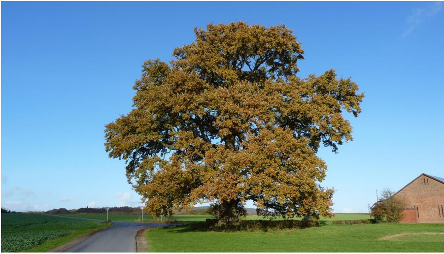
Naturdenkmal Eiche