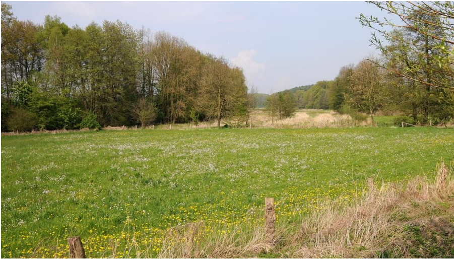
NSG Kilverbachtal