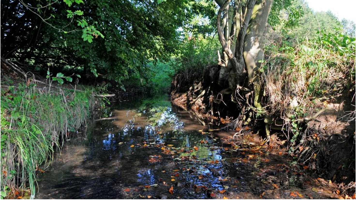
Kilverbach im Naturschutzgebiet