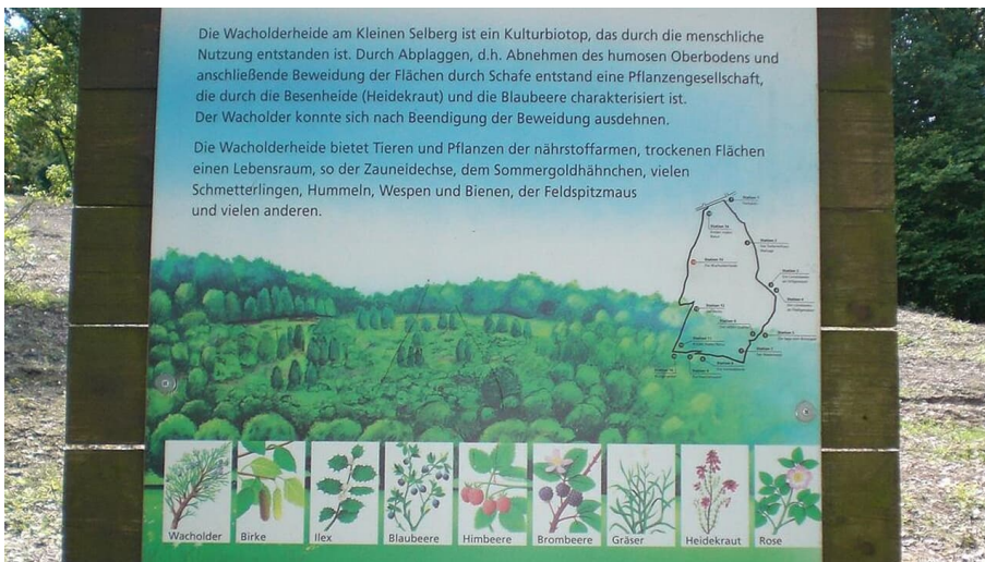
Naturerlebnispfad Bonstapel