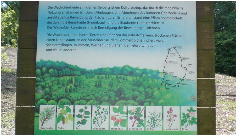
Naturerlebnispfad Bonstapel