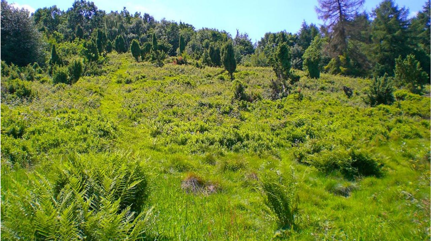
Infostation Wacholderheide