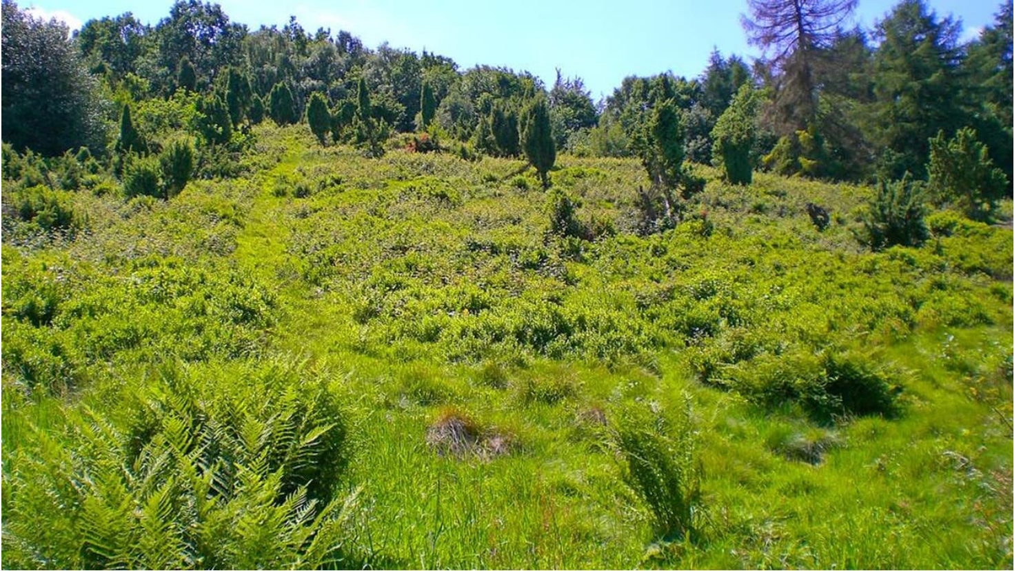
Infostation Wacholderheide - © Biologische Station Ravensberg im Kreis Herford e.V.