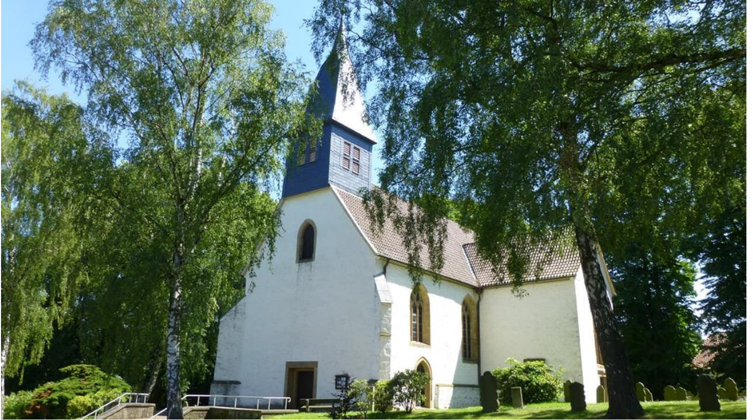
Valdorfer Kirche