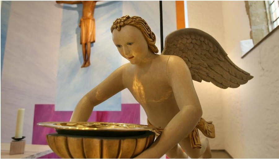
Taufengel in der Kirche Valdorf