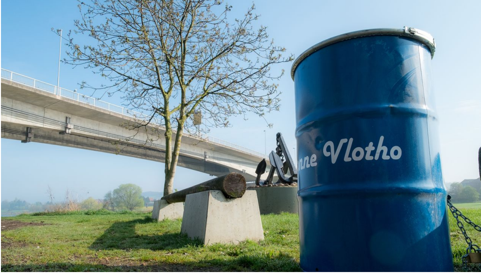
Hafen Vlotho

ID: p_100039730 Zuletzt geändert am 01.02.2024, 08:19