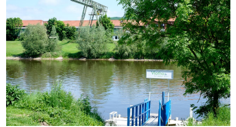
Vlothoer Hafen