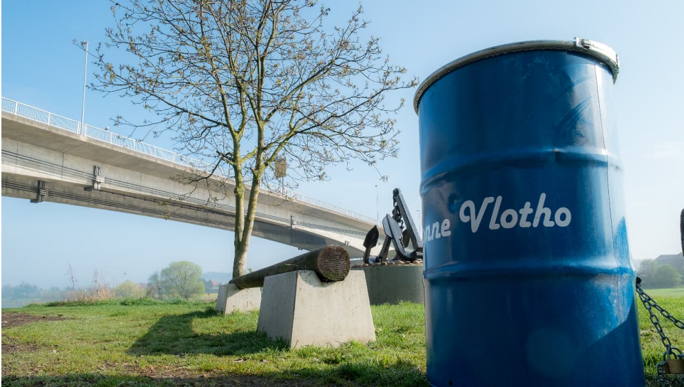
Hafen Vlotho