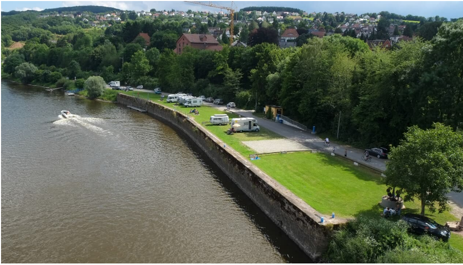
Vlothoer Hafen