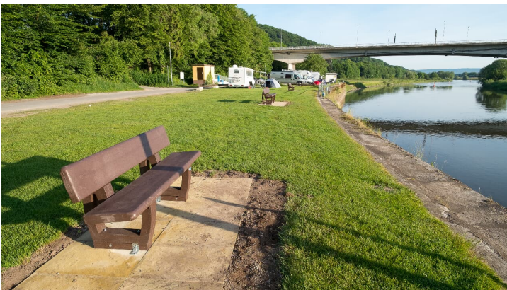
Vlothoer Hafen