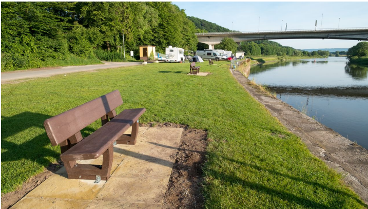
Vlothoer Hafen - © Juergen Finkhaeuser