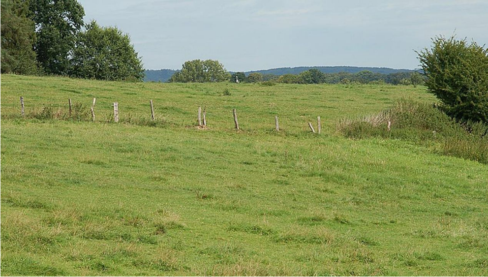
NSG Rehmerloh-Mennighüffer- Mühlenbach