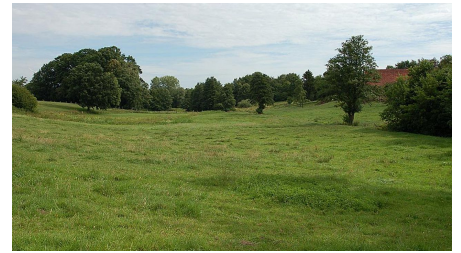
NSG Rehmerloh-Mennighüffer- Mühlenbach - © Biologische Station Ravensberg im Kreis Herford e.V.