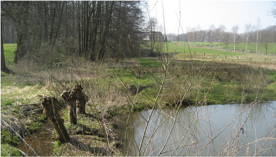
NSG Rehmerloh-Mennighüffer- Mühlenbach - © Biologische Station Ravensberg im Kreis Herford e.V.