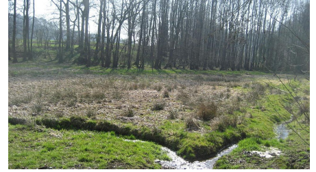
NSG Rehmerloh-Mennighüffer- Mühlenbach