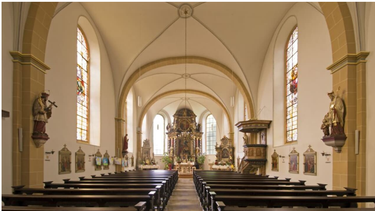
Mariä Himmelfahrt Kirche in Bad Driburg - Pömben.jpg