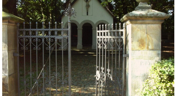
Antoniuskapelle Neuenheerse