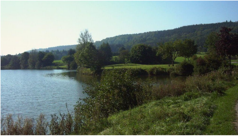
Stausee Neuenheerse