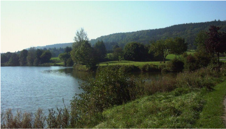
Stausee Neuenheerse