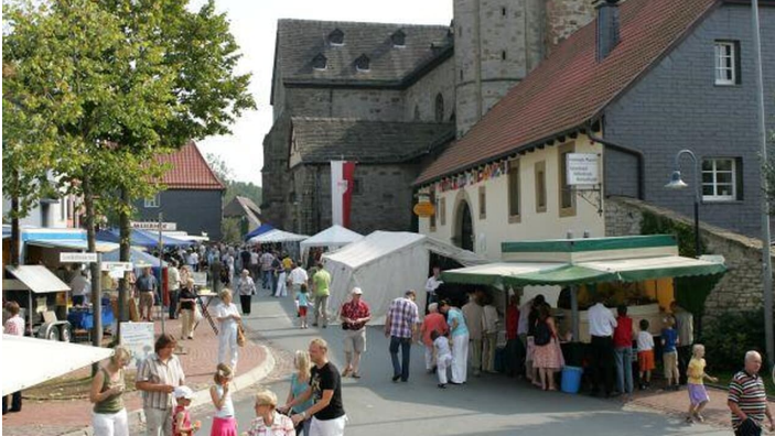
Stiftsmarkt in Neuenheerse, Bad Driburg