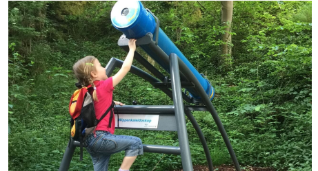
Das Wippenkaleidoskop können Sie auf und ab bewegen