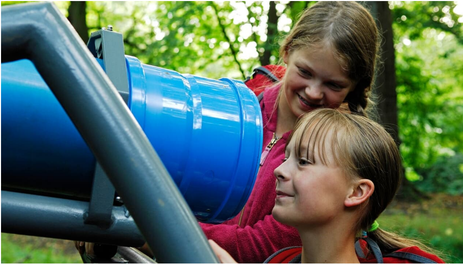
Bad Driburg-Kaleidoskopweg-Wippenkaleidoskop auf dem Rosenberg - © Bad Driburger Touristik GmbH, Sylvie Thormann

Das Wippenkaleidoskop lässt sich auf und ab bewegen. Heben Sie das Kaleidoskop zunächst an und dann wieder herab. Wenn Sie dann hineinschauen, rollen mehrere Kugeln auf Sie zu.