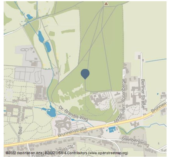
©2022 destination one | ©2022 OSM & Contributors (www.openstreetmap.org)

Der 5,8 Kilometer lange Rundweg startet am Freizeitbad und kann in zwei Schleifen von 2,5 Kilometern (nördliche Schleife / Rosenberg) bzw. 3,3 Kilometern (südliche Schleife / Arboretum) geteilt werden. Bei der Wanderung über die gepflegten, gut markierten und mit einer Zielwegweisung versehenen Wege eröffnen sich immer wieder herrliche Ausblicke in die Landschaft des Naturparks Teutoburger Wald / Eggegebirge.