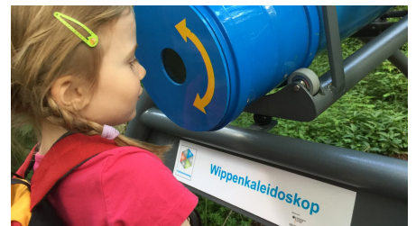
Nach dem Herabbewegen schauen Sie in das Kaleidoskop