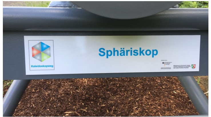
Das Sphäriskop ist Teil des Kaleidoskopwegs