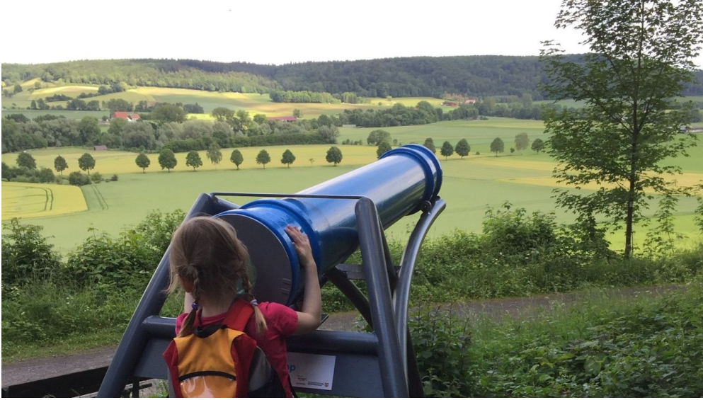
Blick durch das Sphaeriskop