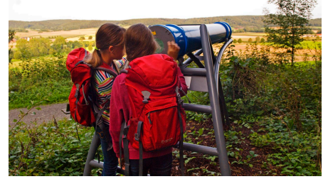
Mädchen mit Rucksäcken schauen durch das Sphäriskop - © Sylvie Thormann, Bad Driburger Touristik GmbH