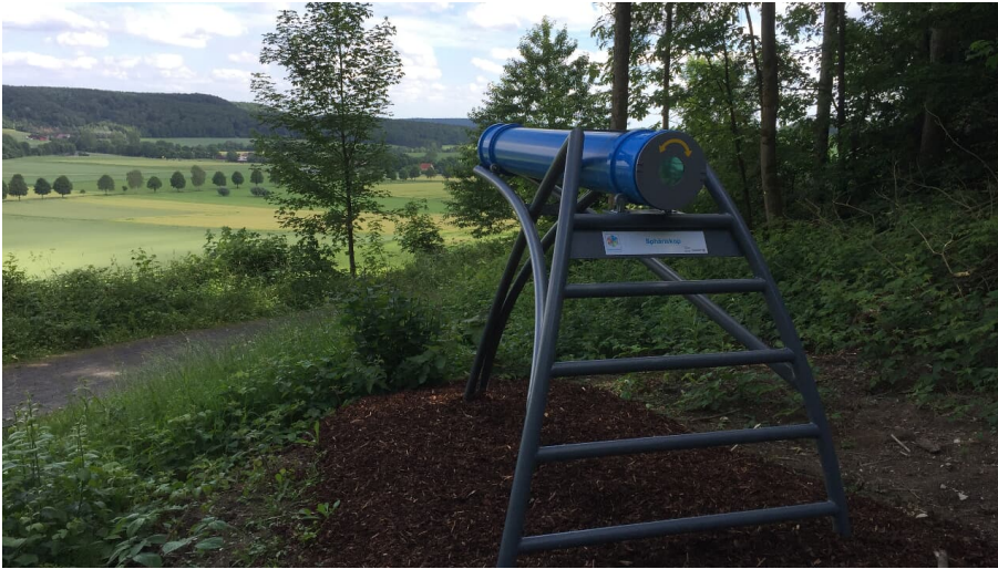
Vom Sphäriskop hat man einen herrlichen Ausblick auf den Ortsteil Alhausen