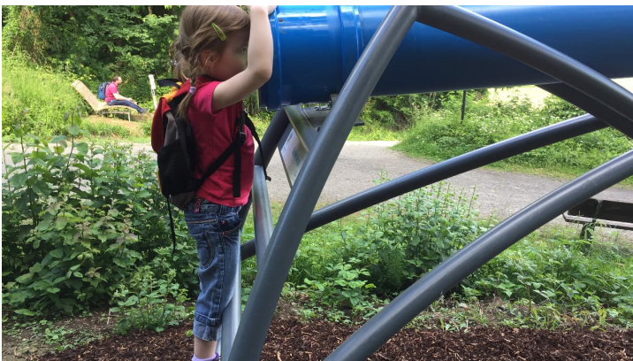
Am Sphäriskop laden eine Liegebank und eine Sitzbank zur Rast ein