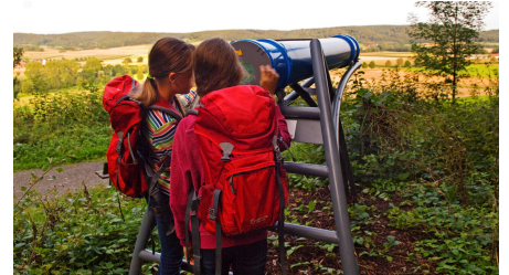
Mädchen mit Rucksäcken schauen durch das Sphäriskop