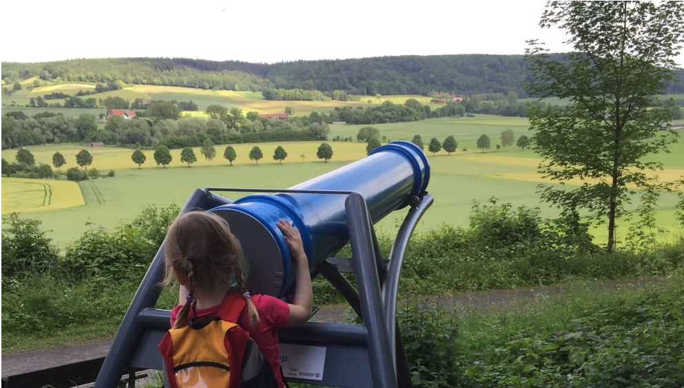
Blick durch das Sphaeriskop - © Bad Driburger Touristik GmbH

Quelle: destination.one ID: p_100039762 Zuletzt geändert am 01.02.2022, 14:40