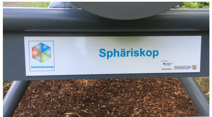
Das Sphäriskop ist Teil des Kaleidoskopwegs