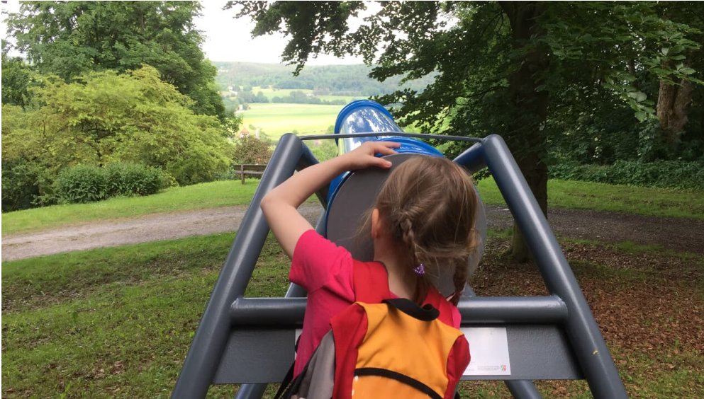
Im Kaleidoskop zaubern bunte Farbscheiben immer wieder neue Bilder - © Bad Driburger Touristik GmbH

Quelle: destination.one ID: p_100039765 Zuletzt geändert am 01.02.2022, 14:40