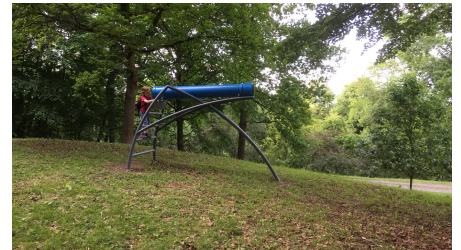
Das Kaleidoskop liegt oberhalb einer kleinen Obstwiese