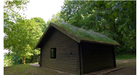
Neben dem Kaleidoskop lädt eine Schutzhütte zur Rast ein