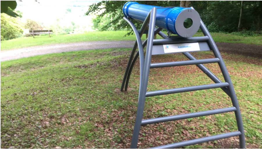
Das Kaleidoskop liegt direkt im Arboretum