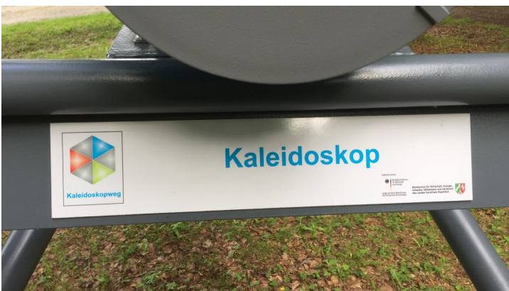
Das Kaleidoskop ist Teil des Kaleidoskopwegs