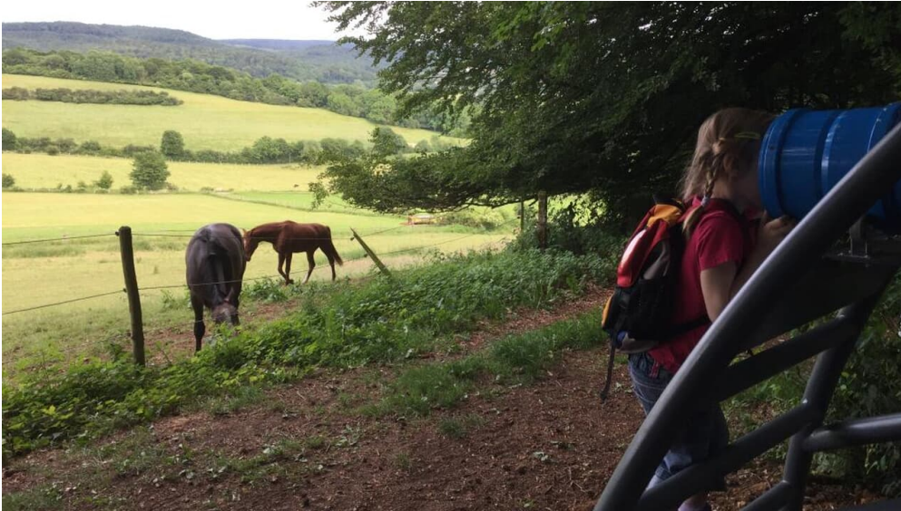
Das Zeitlupenkaleidoskop steht am Hang des Rosenbergs unterhalb des Arboretums