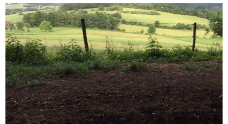
Von hier genießen Sie einen schönen Blick in die Schwalle