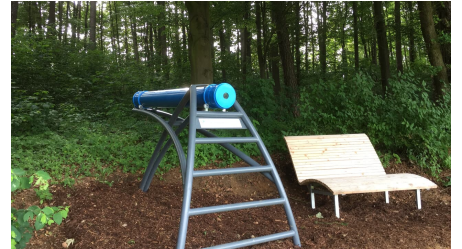
Das Zeitlupenkaleidoskop steht direkt neben einer Liegebänk