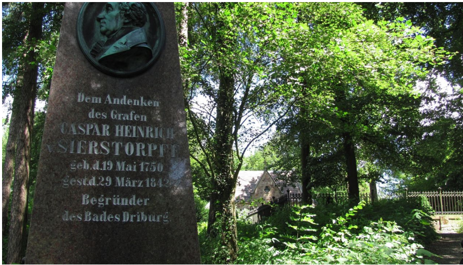
Mausoleum und Obelisk auf dem Rosenberg