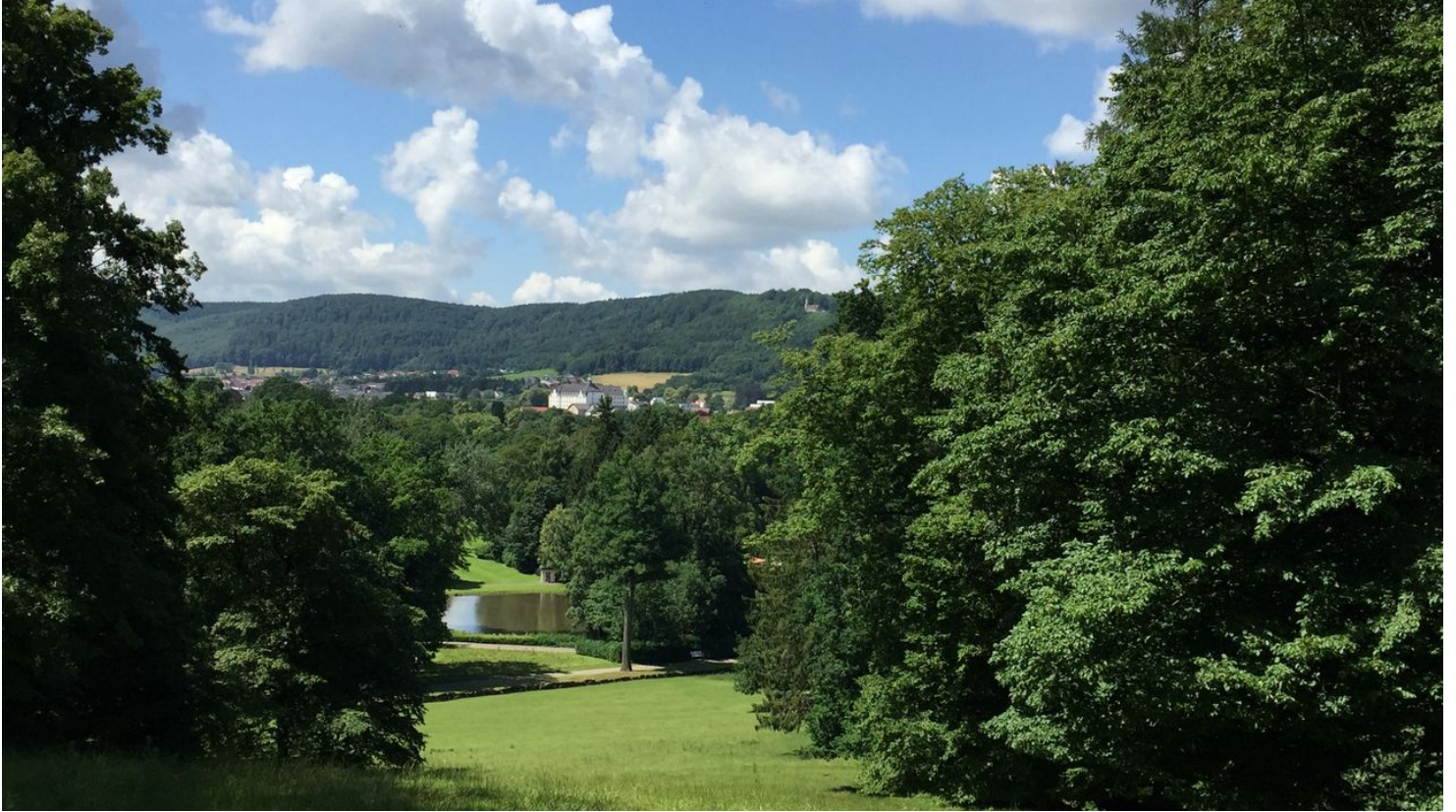
Blick vom Rosenberg auf den Gräflichen Park