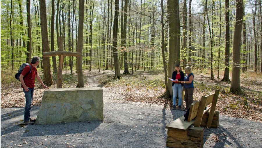
Friedwald Nonnenbusch