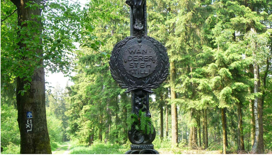
Schwarzes Kreuz