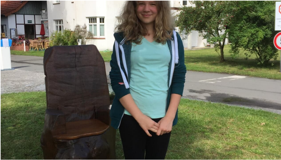
Selfie Point vor dem Campingplatz am Furlbach in SHS