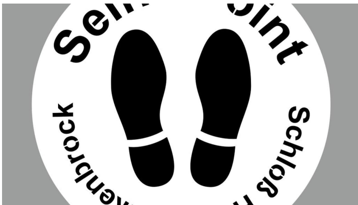
Selfie-Point SHS Schablone