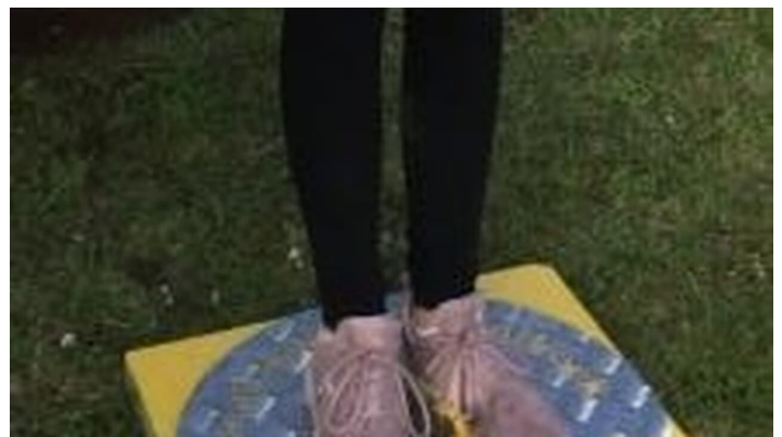
Selfie Point Campingplatz Am Furlbach gut sichtbar auf gelber Steinplatte