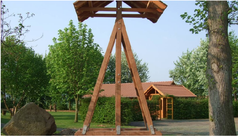
Glocke am historischen Dorfplatz Getmold