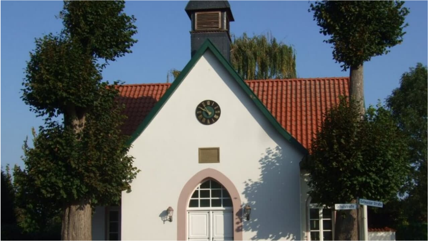
Alte Schule am Dorfplatz Getmold