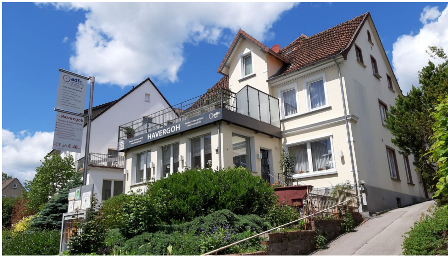
Havergoh seitlich.jpg - - info@hornbadmeinberg.de