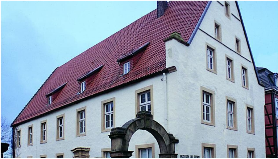
Museum im "Stern" - © Warburg-Touristik e.V., Warburg-Touristik e.V.