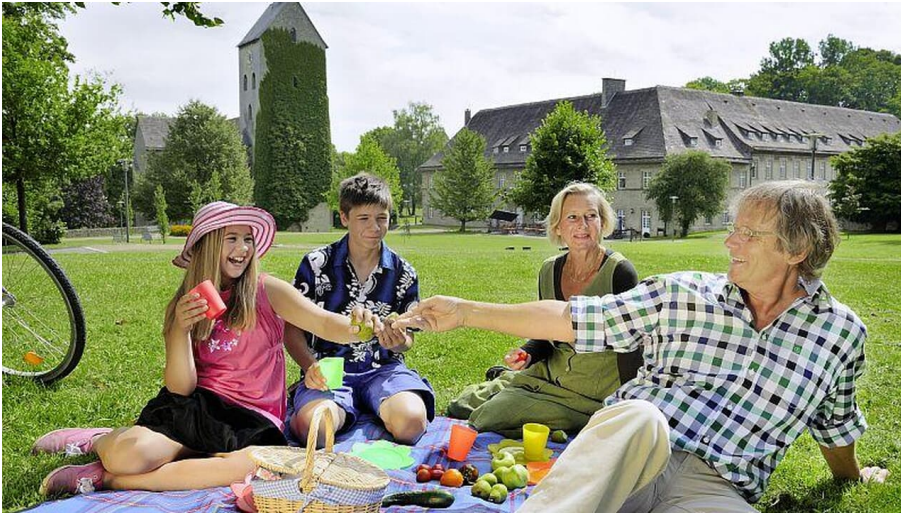
Picknick im Schlosspark Brakel-Gehrden