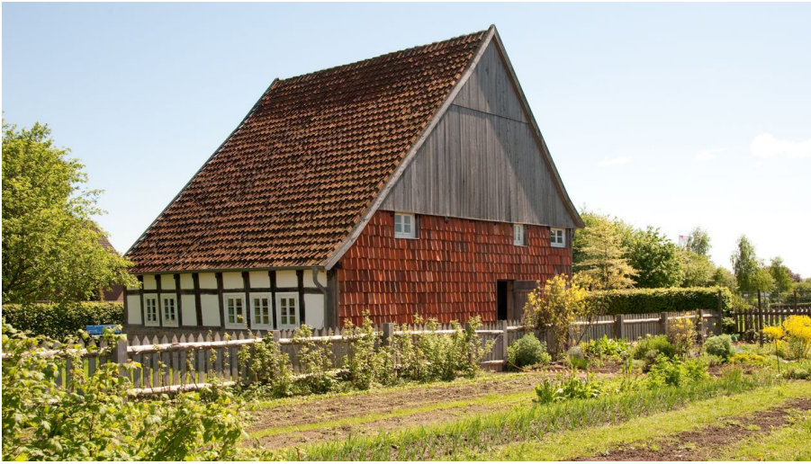
LWL-Industriemuseum, Annette Hudemann