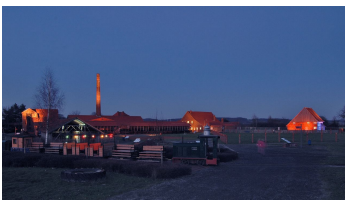
LWL-Industriemuseum, Martin Holtappels