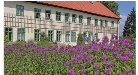
Glashütte Gernheim: Herrenhaus