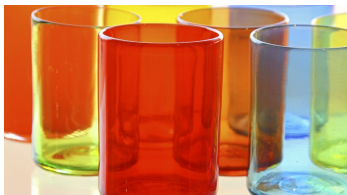
Gernheimer Glas