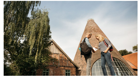
Glashütte Gernheim