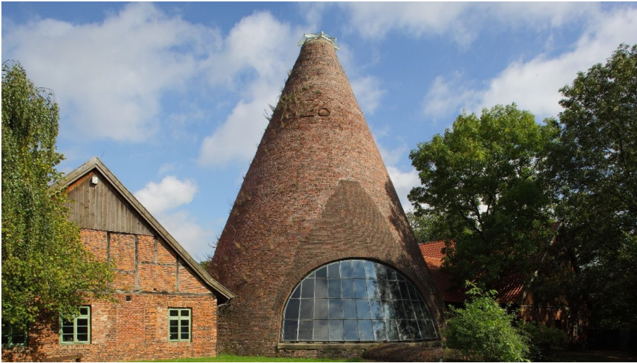
Glashütte Gernheim