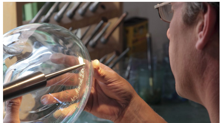
Glashütte Gernheim: Glasbe- und Verarbeitung