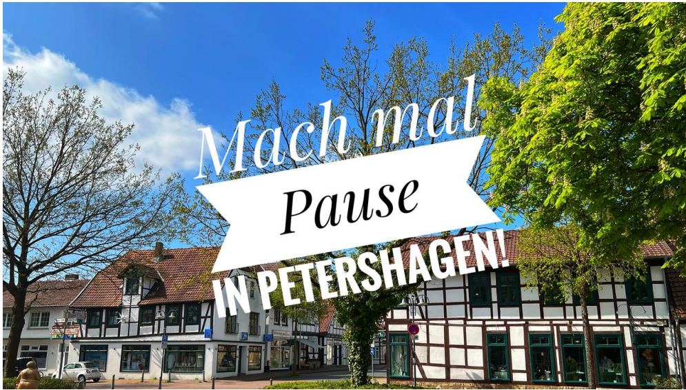
Symbolfoto.jpg - - tourismus@petershagen.de