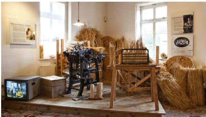
Glashütte Gernheim: Korbflecherei