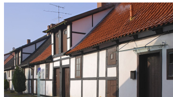
Glashütte Gernheim: Arbeiterhäuser