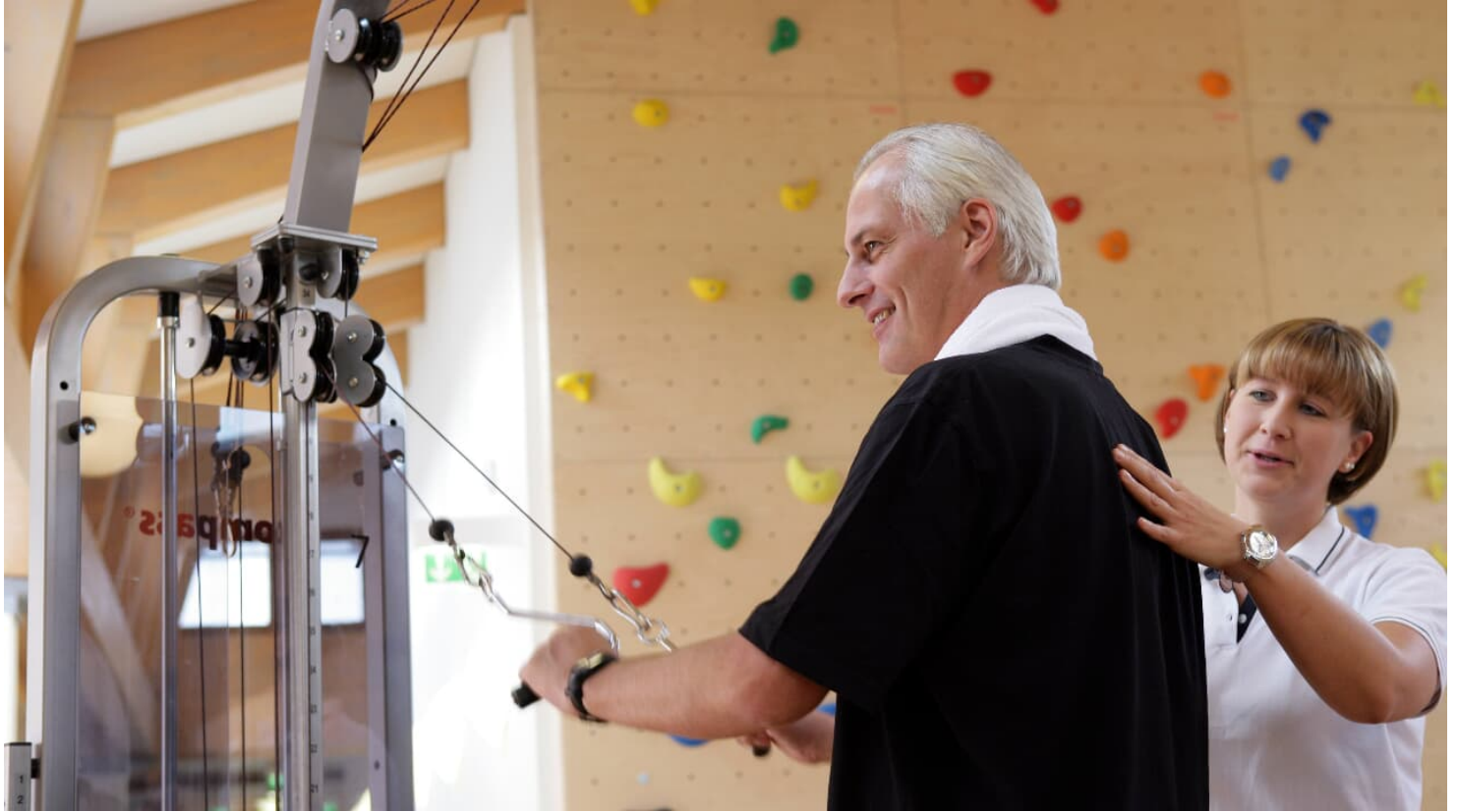
Sporttherapeutisches Zentrum