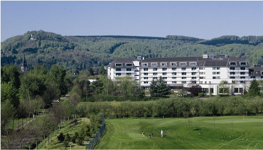
Caspar Heinrich Klinik