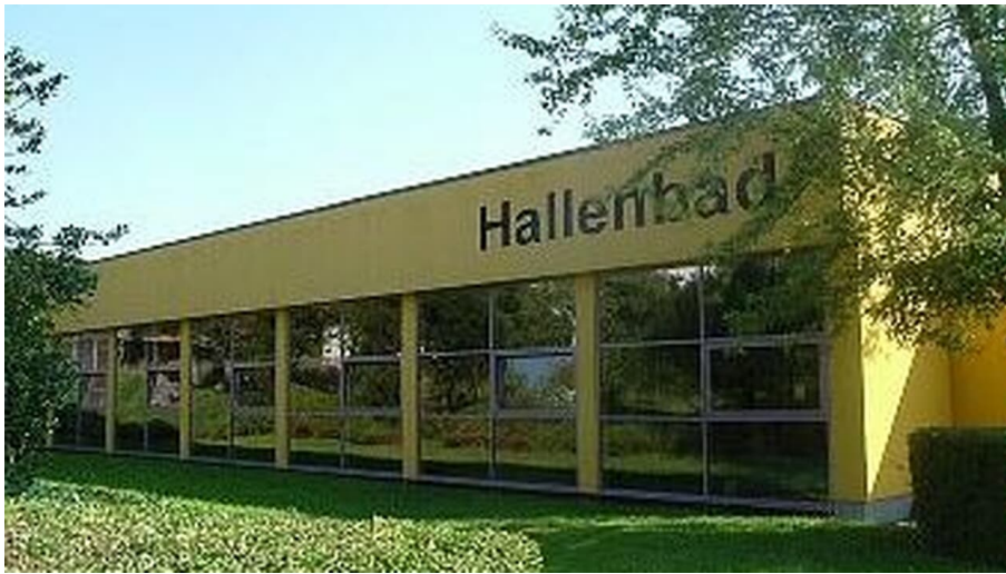
Städtisches Hallenbad