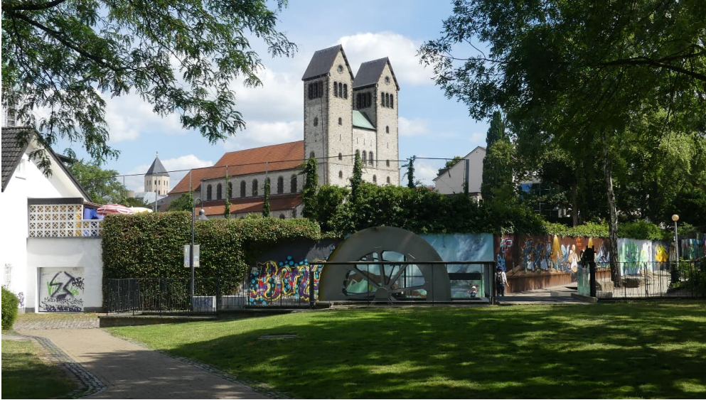
Funktionsmodell und Abdinghofkirche