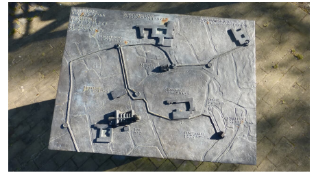
Schematische Darstellung der historischen Wasserkunst - © Karl Heinz Schäfer, Tourist Information Paderborn / Verkehrsverein Paderborn e.V.