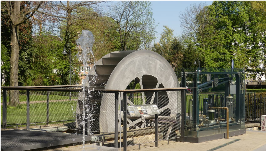
Funktionsmodell der Wasserkunst