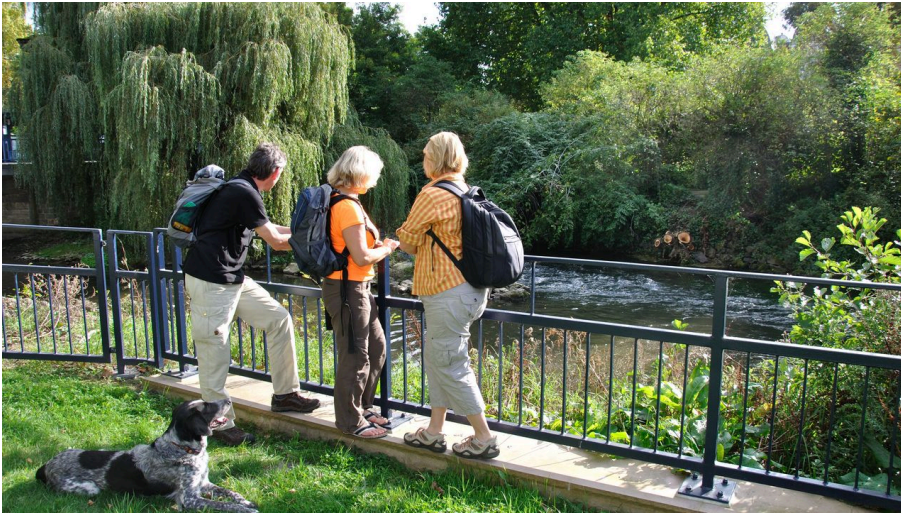
Pader-Lippe-Zusammenfluss (Blick vom Amtsweg)