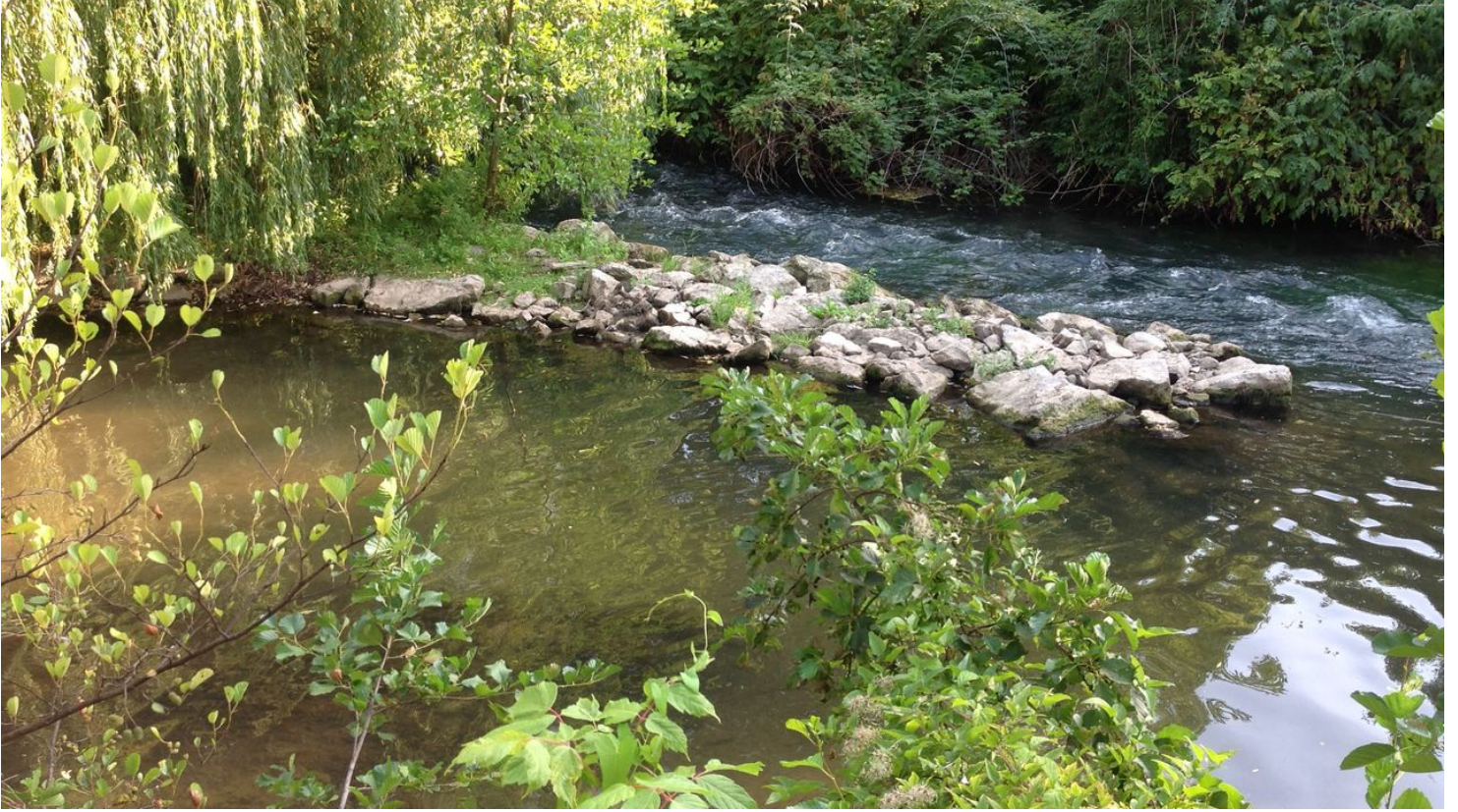
Zusammenfluss von Pader (sprudelnd; oben im Bild) und Lippe (Blick vom Amtsweg)