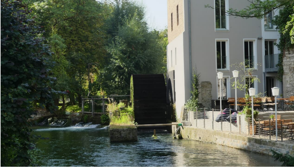
Stümpelsche Mühle und Terrasse des Mühlencafés

Die aktuellen Öffnungszeiten des Mühlencafés erfahren Sie unter www.muehlencafe.info .