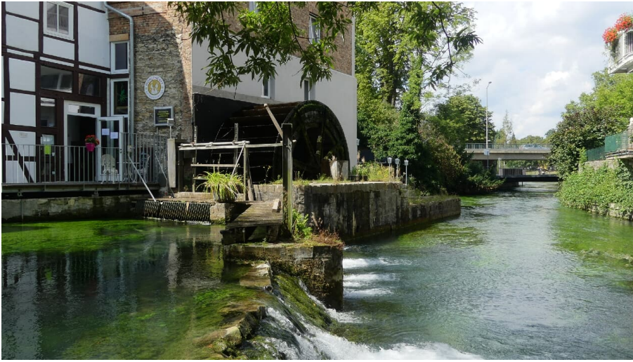
Stümpelsche Mühle