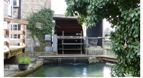
Stümpelsche Mühle