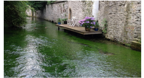
Pader in der Nähe der Stümpeelschen Mühle