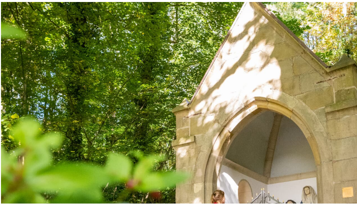
Lichtenau-Wallfahrtsge#nde Kleinenberg-Teutoburger-Wald-Tourismus-D-Ketz-055.jpg