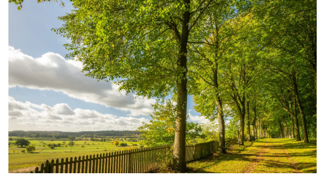
Lichtenau-Wallfahrtsge#nde Kleinenberg-Teutoburger-Wald-Tourismus-D-Ketz-057.jpg