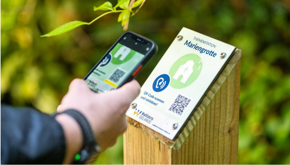
Lichtenau-Wallfahrtsge#nde Kleinenberg-Teutoburger-Wald-Tourismus-D-Ketz-054.jpg