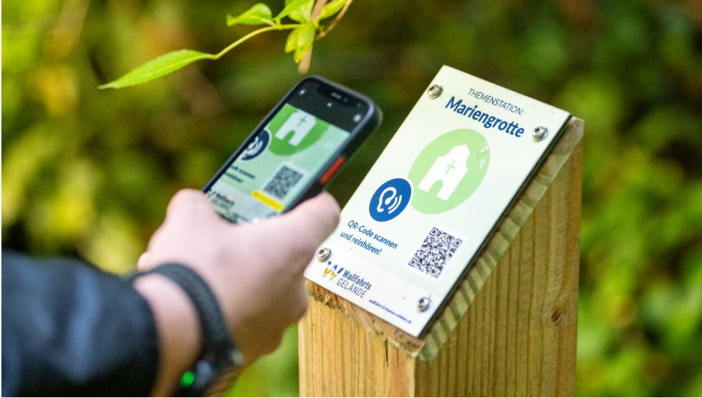
Lichtenau-Wallfahrtsge#nde Kleinenberg-Teutoburger-Wald-Tourismus-D-Ketz-054.jpg