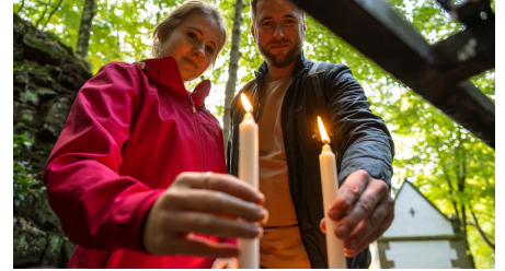
Lichtenau-Mariengrotte-Wallfahrtsge#nde Kleinenberg-Teutoburger-Wald-Tourismus-D-Ketz-050.jpg