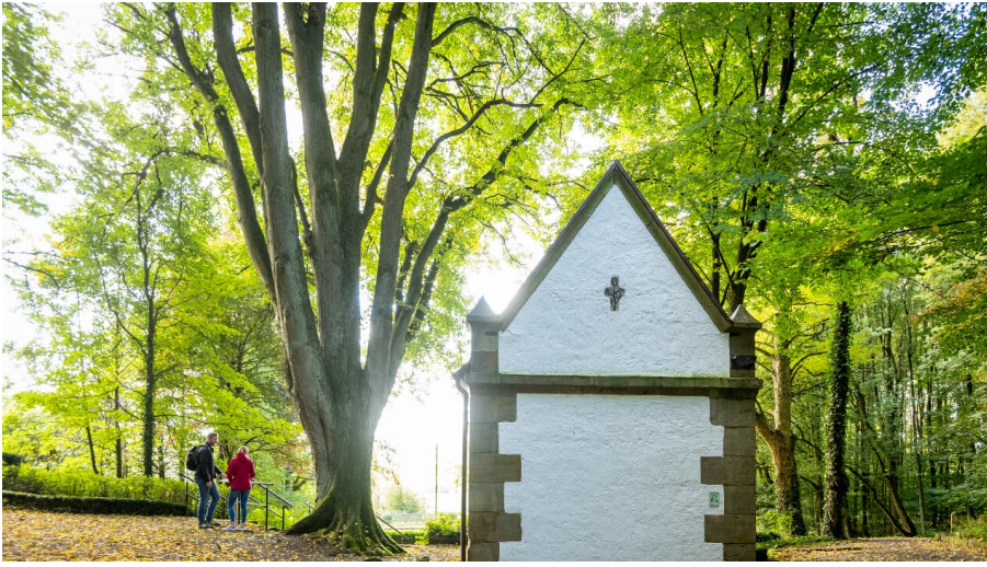
Lichtenau-Wallfahrtsgela#nde Kleinenberg-Teutoburger-Wald-Tourismus-D-Ketz-053.jpg

Nach dem Volksmund war die Erscheinung eines Muttergottesbildes Anlass zur Entstehung Der Wallfahrt in Kleinenberg. An der Stelle der Erscheinung entstand ein schöner Barockbau.