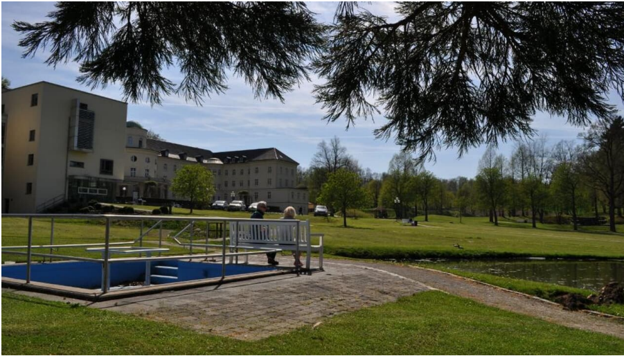
Wassertretbecken Park Klinik Bad Hermannsborn