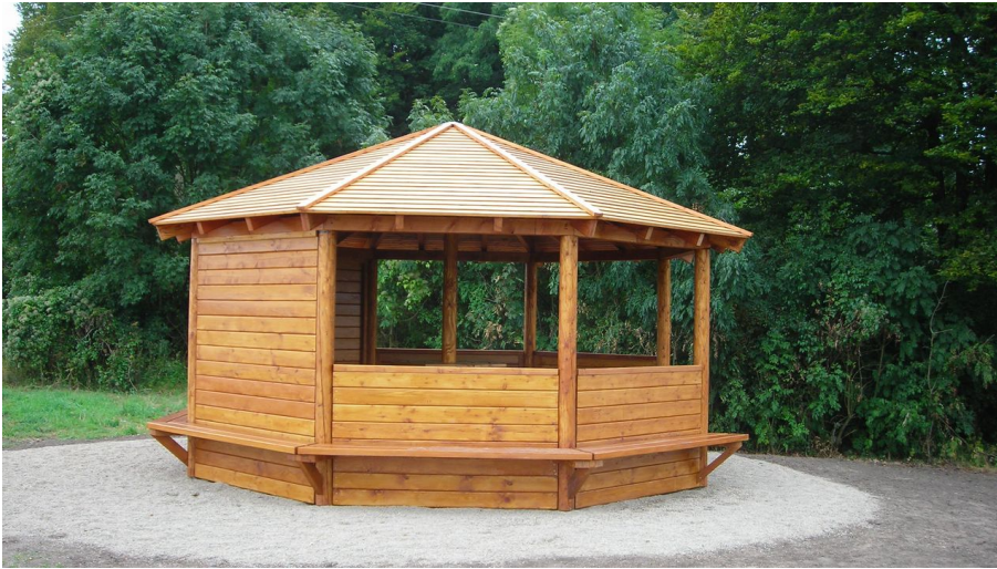
Schutzhütte Lengericher Berg