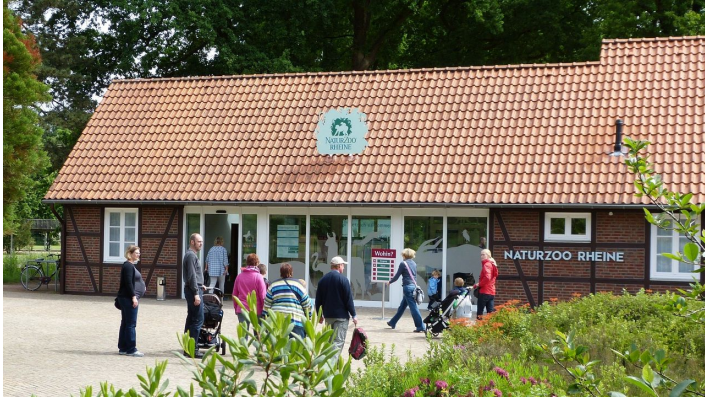
NaturZoo Rheine