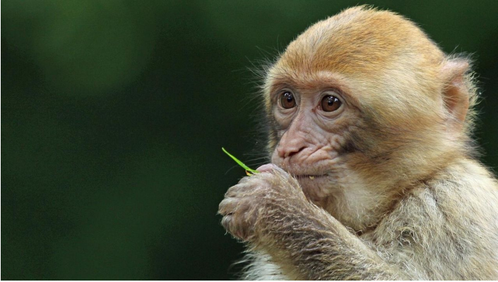
NaturZoo Rheine

Der Zoo ist ganzjährig täglich ab 9.00 Uhr geöffnet. im Sommer: bis 18.00 Uhr, an Sonn- und Feiertagen bis 19.00 Uhr im Winter: bis zum Einbruch der Dämmerung.