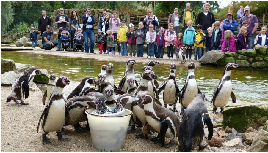
NaturZoo Rheine