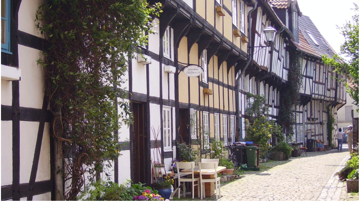
Adolfstraße - Detmold