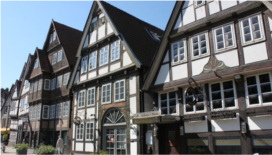
Historischer Stadtkern Detmold - © www.detmold.de