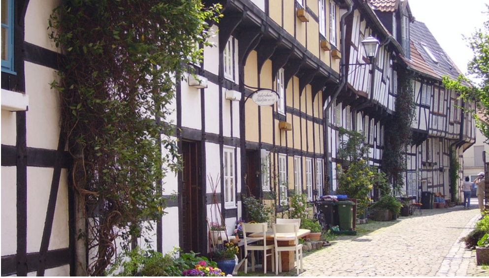
Adolfstraße - Detmold