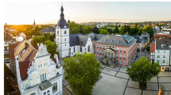
Detmold-2023-017-Innenstadt-Teutoburger-Wald-Tourismus-D-Ketz.jpg - © Dominik Ketz