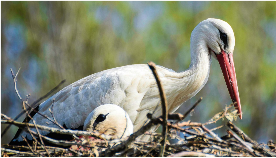
Storchenstation