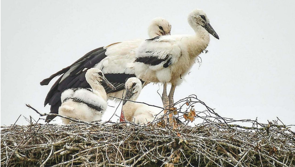
Jungstörche in Elbrinxen - - touristinfo@luegde.de

Geführte Touren durch die Anlage sind auf Anfrage möglich. Die Storchennester sind aber auch ohne Führung, von außen sichtbar.