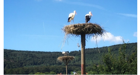
Storchestation Elbrinxen