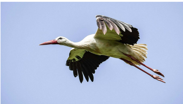
Storch