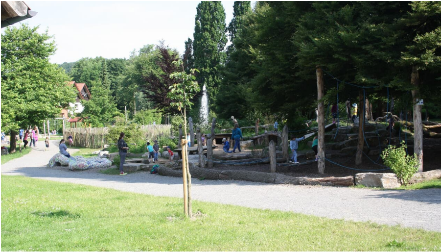
Spiel- und Rastplatz