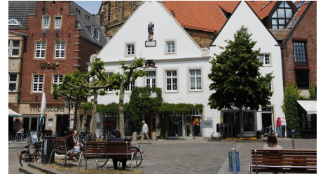
Der Marktplatz in Rheine