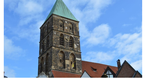
Kirchturm am Marktplatz in Rheine