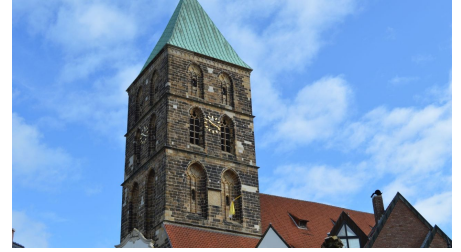
Kirchturm am Marktplatz in Rheine