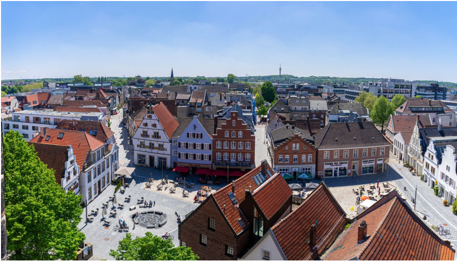
Rheine_Marktplatz03_Bildrechte EWG Rheine.jpg