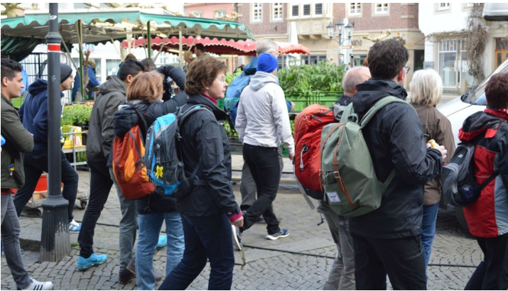
Wanderer auf dem Marktplatz von Rheine