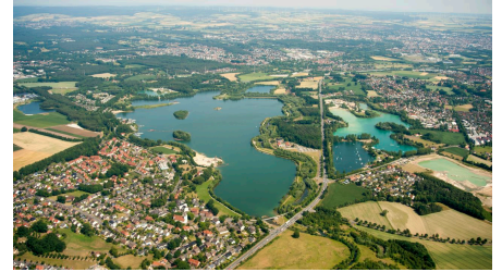
Luftbild: Paderborn-Sande und Lippensee