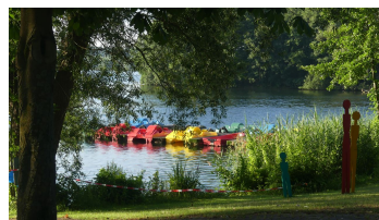
Tretboote am Steg der Seemöwe