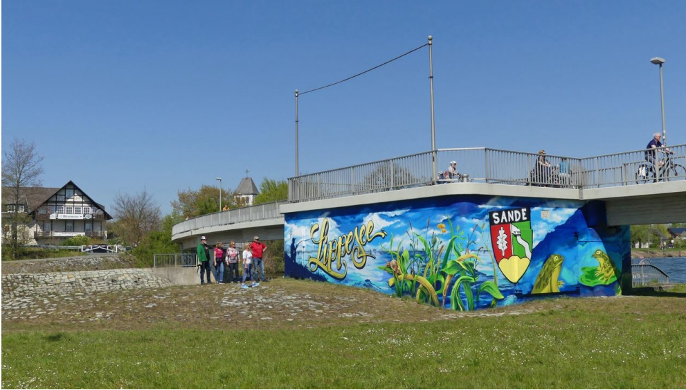
Graffiti am ehemaligen Kraftwerk bei der Fußgängerbrücke

Der Zutritt zum See ist kostenlos. Ausnahmen sind der Badestrand sowie der benachbarte Wasserskisee, bei denen Eintrittsgelder erhoben werden.