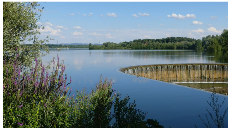
Blick über den Lippesee vom Auslaufbauwerk