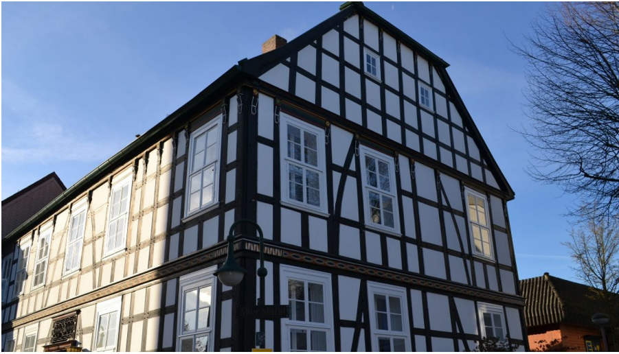
Storck-Haus in Werther (Westf.)