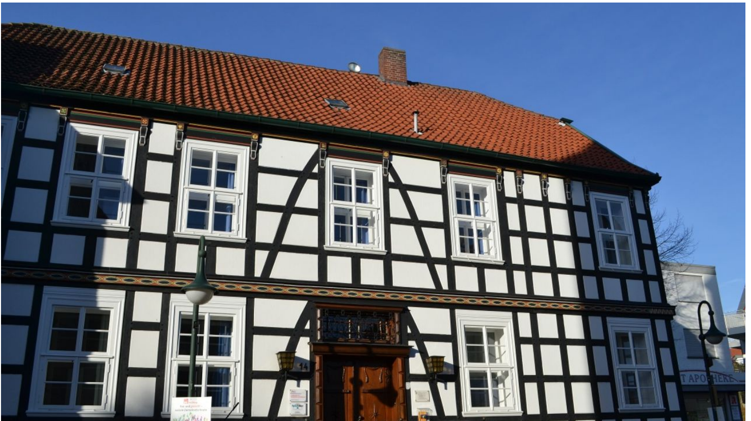
Haupteingang am Storck-Haus in Werther (Westf.)