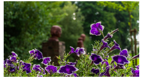
Blühendes am Museum Peter August Böckstiegel