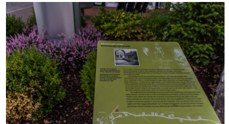
Stele vom Böckstiegel-Pfad