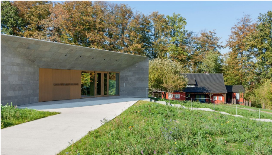
Museum Peter August Böckstiegel