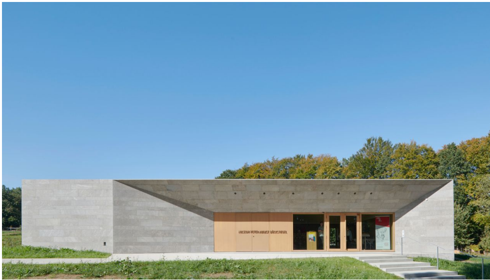
Museum Peter August Böckstiegel

Weitere Informationen zu öffentlichen Führungen finden Sie auf www.museumpab.de