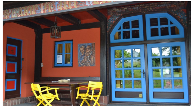
Künstlerhaus von Peter August Böckstiegel