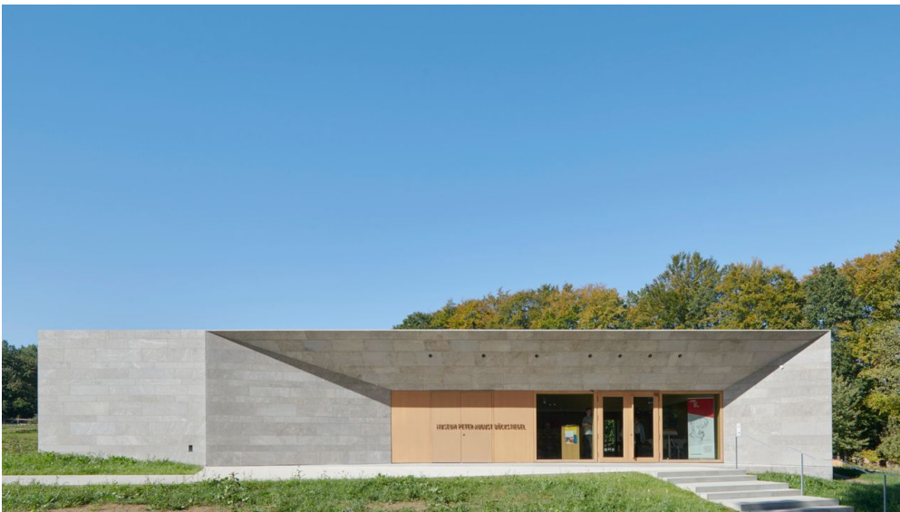
Museum Peter August Böckstiegel

Voor het laatst aangepast 08.04.2024, 12:20