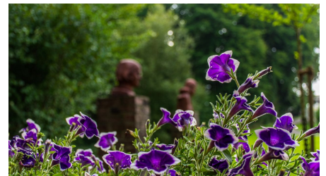
Elke Bitzer, Fotografische Reisen und Wanderungen, Unbekannt