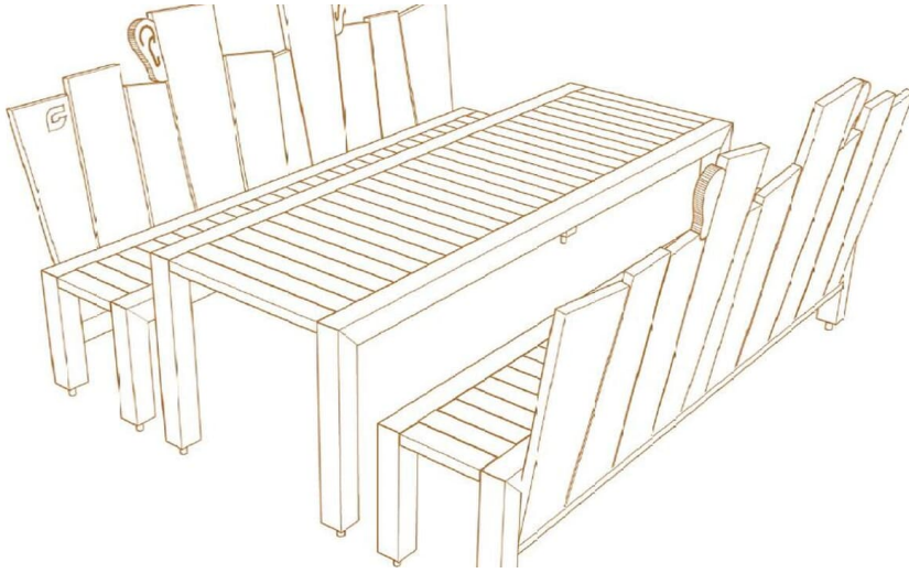
Skizze Ruheplatz "Hören" - © Müller Carmen, Stadt Halle

Der "Hör-Platz" am Wanderweg "Weg für Genießer" befindet sich in der Nähe der Waldkirche Stockkämpen und des Ruthebachs in einem Wäldchen. Umgeben von hohen Laubbäumen erleben Wanderer hier zwischen Waldkirche und Ruthebach ein Naturkonzert - das Rauschen der Blätter im Wind. Mit zwei Hörtrichtern in 20 Metern Abstand lässt sich hier außerdem prima in die Ferne lauschen oder einander zuflüstern.