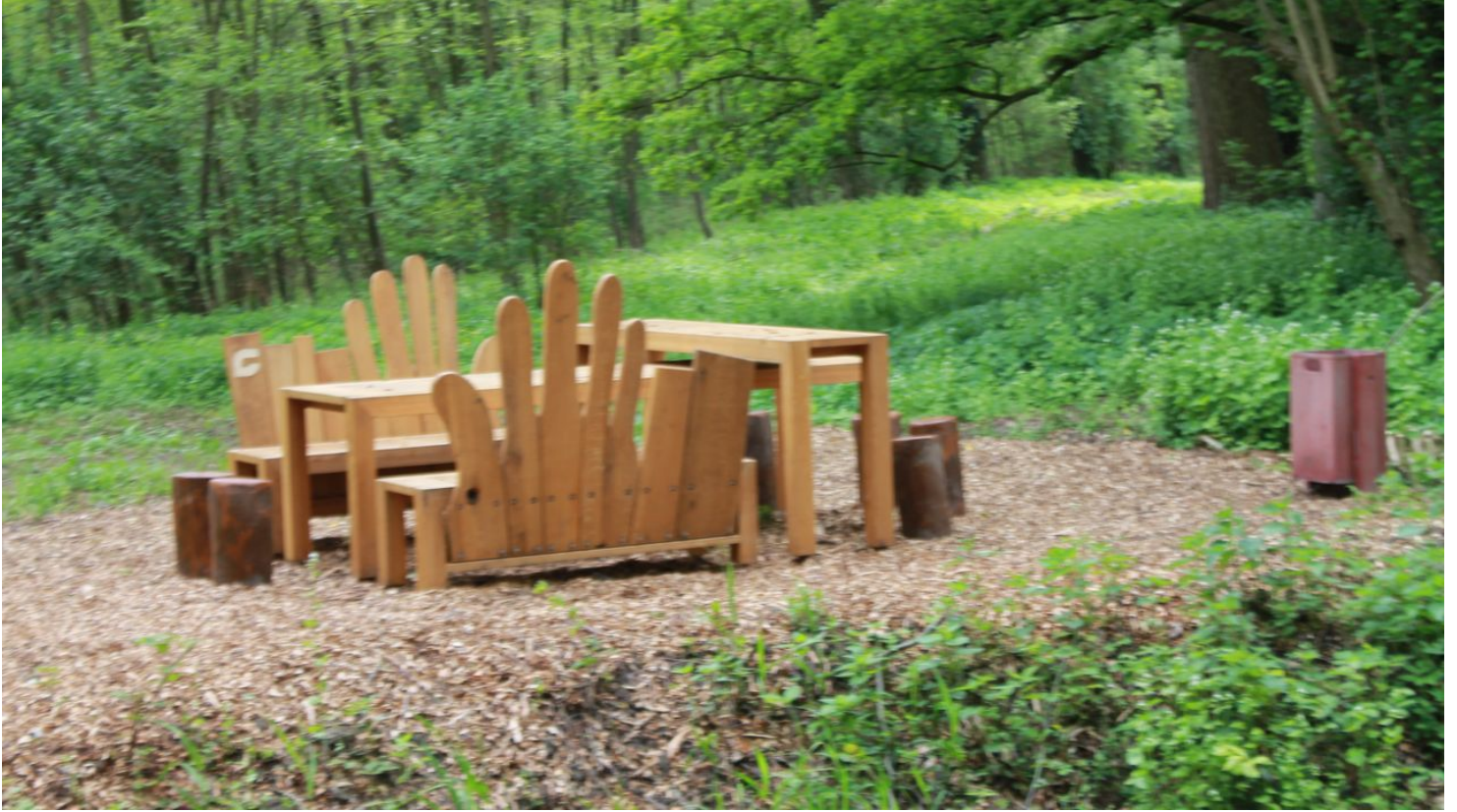
Rastplatz "Fühlen" - © Jennifer Oldach, Stadt Versmold

Quelle: destination.one ID: p_100040114 Zuletzt geändert am 01.02.2022, 14:44