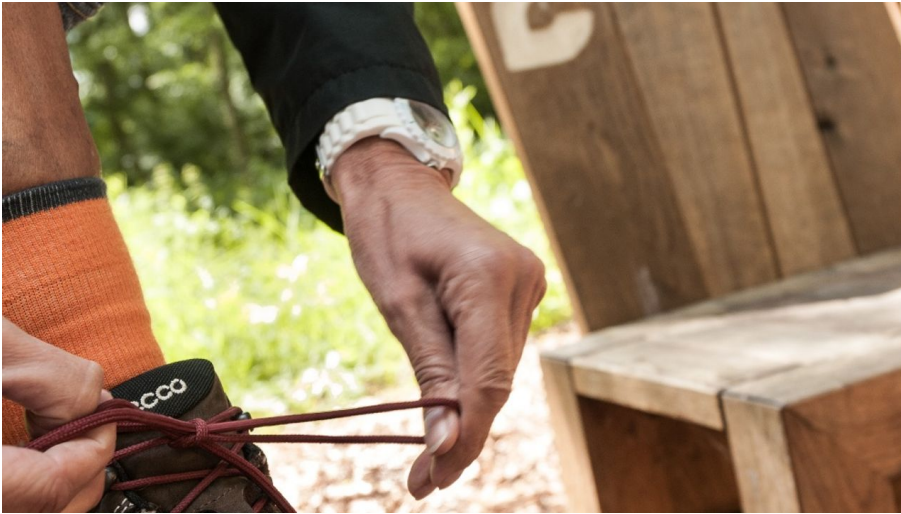
Rastplatz \"Fühlen\" am Weg für Genießer - © Daniela Berheide, AG Weg für Genießer