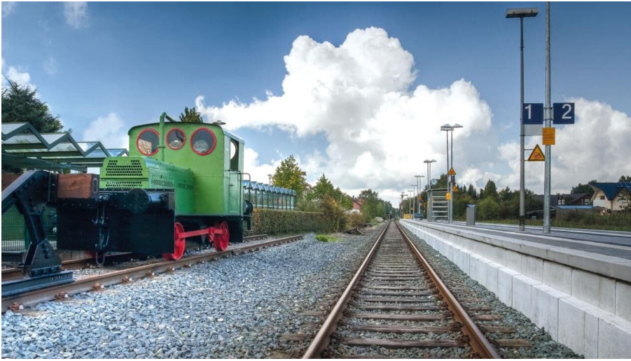
Alte Geha-Lok am Hövelhofer Bahnhof